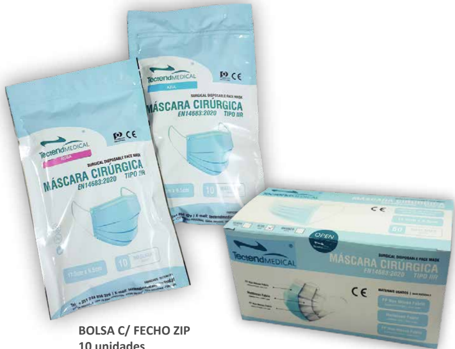
BOLSA C/ FECHO ZIP 10 unidades